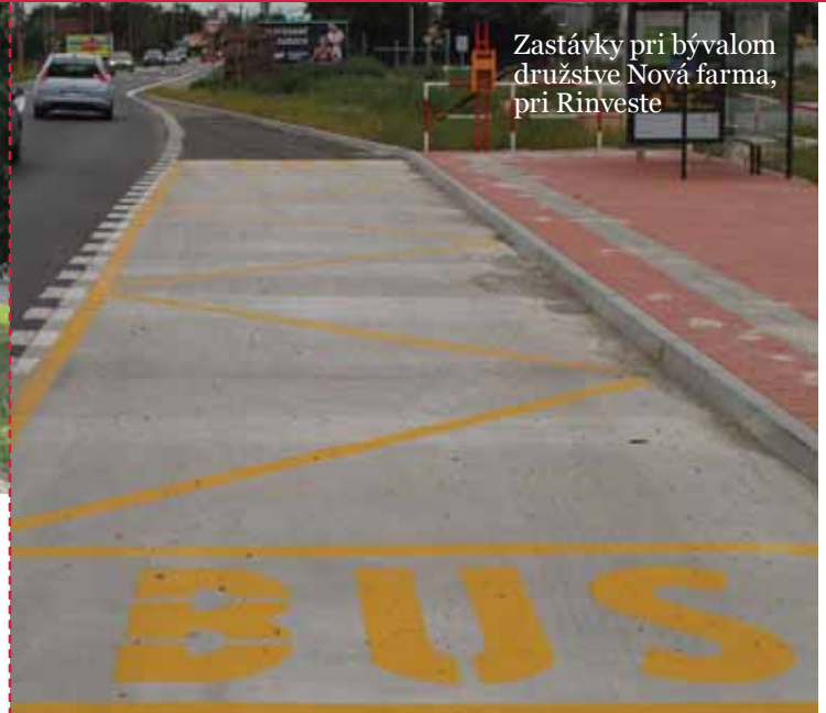
Zastávky pri bývalom družstve Nová farma, pri Rinveste