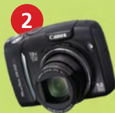
2 Fotoaparát CANON PowerShot SX110