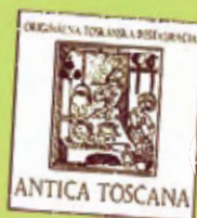
3 Večera pre dve osoby v reštaurácii TOSCANA v Rusovciach