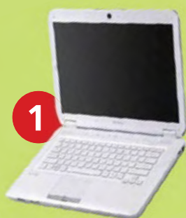
1 Notebook SONY Vaio CS215

Súťaž sa začala 23. februára 2009. Najrýchlejší vyhráva.