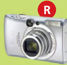
R Cena za najrýchlejšiu správnu odpoveď: Fotoaparát CANON Digital IXUS 970