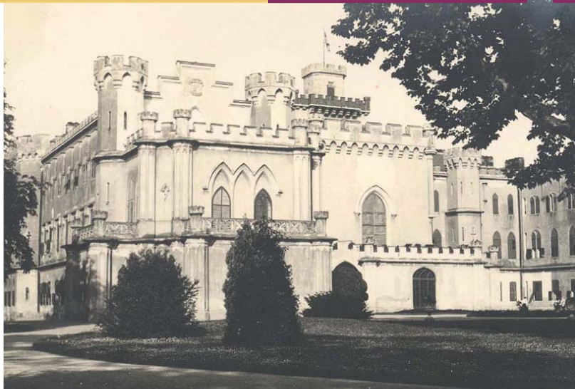
Rusovský kaštieľ, okolo roku 1910